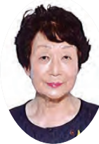
滋賀県更生保護女性連盟