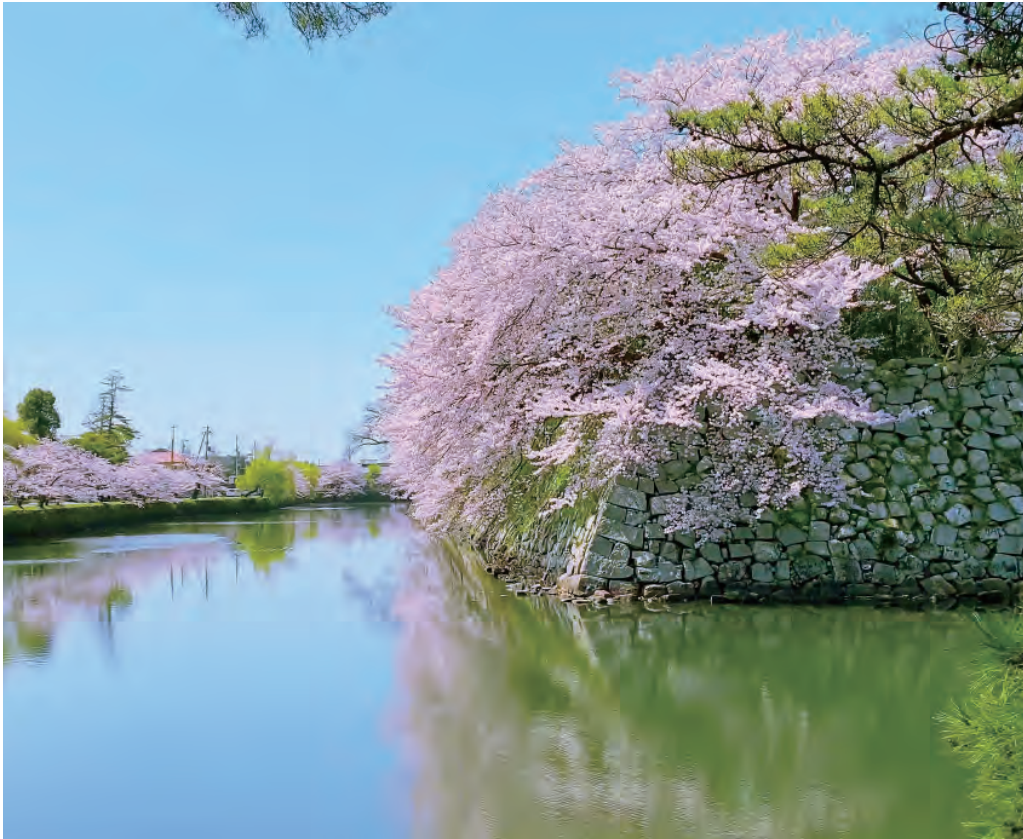
春の北近江・湖北 桜の季節の「国宝・彦根城」堀端の桜